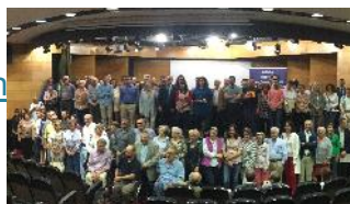
Acte de lliurament de les subvencions per aquest 2015 de l'entitat Estalvi Ètic de Colonya

La Xarxa per a la inclusió Social. EAPN-Illes Balears i els grups municipals de l'Ajuntament de Palma han signat avui matí un Pacte Municipal per a la Inclusió Social.