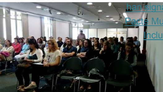
Caixa Pollença 15.05.15 II Trobada Professionals