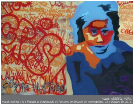
Autors: AEROSOL WORK, mural realitzat a la I Trobada de Participació de Persones en Situació de Vulnerabilitat, 15 d'octubre de 2011.

O, en lloc de reduir els serveis d'ajuda a les persones amb dependència (intentant estalviar 600 milions d'euros), podrien haver reduït el subsidi de l'Estat a l'Església catòlica per impartir docència de la religió catòlica a les escoles públiques, o eliminar la producció de nou equipament militar, com els helicòpters Tigre i altres armaments.