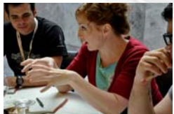
Participació als grups de treball.