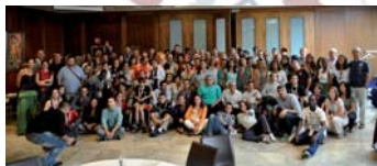
Fotografia grupal dels participants a la 7a Trobada Estatal de Participació de Persones en situació de Pobresa i d'Exclusió Social.

Plataformes i trobades d'aquest tipus fan visible i donen veu a una gran part de la societat que necessita ser tinguda en compte, perquè, en realitat, és la que sofreix totes les conseqüències de les decisions polítiques que es prenen en els nivells més alts. Unim les nostres forces i elevem la nostra veu perquè la societat que heretin els nostres fills sigui més justa.