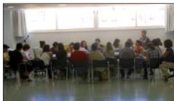
Posada en comú de les conclusions dels grups de treball