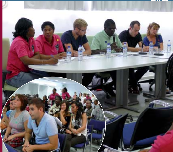
Taula rodona d'experiències "Ciutadania en temps de crisi". Associació de dones nigerianes, Associació de joves de Son Roca i Naum, Grup de ciutadania de Carítas Mallorca i Banc de Temps.