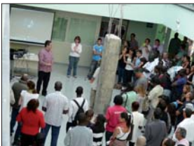
Presentació de la I Trobada de Persones en situació de Vulnerabilitat

Amb motiu del Dia Mundial de Lluita contra la Pobresa i l'Exclusió Social, que va tenir lloc el passat 17 d'octubre, la Xarxa Espanyola de Lluita contra la Pobresa i l'Exclusió Social (EAPN-ES) i la Xarxa per a la Inclusió Social, EAPN - Illes Balears varen organitzar la trobada de persones en situació de vulnerabilitat "Crisi i convivència, veus per a una nova ciutadania".