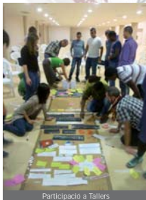
Participació a Tallers

Els dies 19, 20 i 21 d'octubre passats des d'EAPN - Illes Balears - varem participar en "les jornades 'El barri, escola de ciutadania i convivència' que es desenvoluparen a Daimiel (Ciudad Real) i que organitzava EAPN-Espanya conjuntament amb la Fundació CEPAIM.