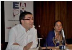
Participació als tallers.