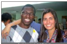
Participants de la I Trobada de Persones en situació de Vulnerabilitat