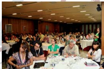
7a Trobada Estatal de Participació de Persones en Situació de Pobresa i Exclusió Social.