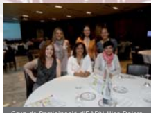
Grup de Participació d'EAPN-Illes Balears. Xarxa per a la Inclusió Social.