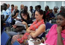
Taula rodona d'experiències "Ciutadania en temps de crisi". Associació de dones nigerianes, Associació de joves de Son Roca i Naum, Grup de ciutadania de Càritas Mallorca i Banc de Temps.

OBJECTIU: amb aquesta trobada, el que es pretenia era donar veu als diferents col·lectius que pateixen especialment la situació de crisi actual a fi de reflexionar sobre com es viu la crisi i com afecta la convivència als nostres pobles i barris, així com formular propostes per construir una nova ciutadania que sorgeixin de la participació de les persones que es troben en situació de més vulnerabilitat.