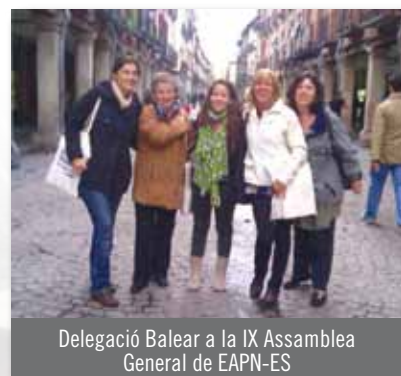
Delegació Balear a la IX Assemblea General de EAPN-ES

Ha arribat el moment de generar riquesa col·lectiva, igualtat entre les persones i els territoris, sinergies amb diferents fórmules emergents com la banca ètica, noves alternatives que posin en valor l'impacte econòmic i social de les entitats socials. Perquè una altra manera de créixer i de desenvolupar la societat és possible.