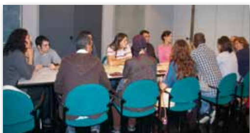
Grup de treball ocupació