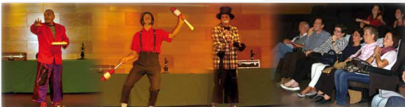
El Circ Bover va participar en la festa de la cloenda de la II Trobada