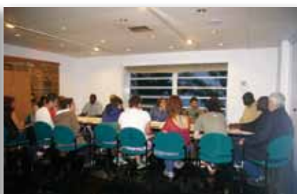
Grup de treball vivenda