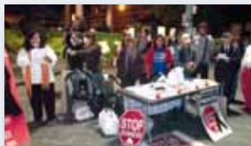
Afectats per les hipoteques

La Plataforma d'Afectades per les Hipoteques és un grup de persones voluntàries preocupades per la situació que viuen famílies senceres a causa de la manca de solucions per part de les institucions que permeten que la banca deixi sense llar famílies senceres i les condemni a un deute per la resta de la seva vida.