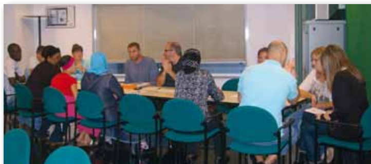
Grup de formació