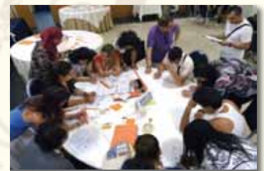
VII Trobada de Participació Estatal

d'oportunitats, i la importància d'adaptar els projectes educatius a les necessitats reals de la societat i les diferents comunitats.