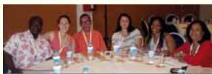
Membres del grup de participació d'EAPN-IB assistents a la VII Trobada de Participació Estatal

Al final de la trobada es posaren en comú les conclusions obtingudes durant els tres dies relacionades amb els temes de formació, treball, salut i habitatge, tenint en compte la participació mútua