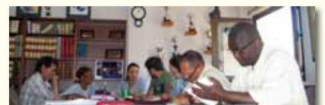
Grup de participació d'EAPN-IB

Si bé és cert que canvis d'aquestes característiques no es veuen d'un dia per l'altre, ni molt manco es consoliden, comencen a partir d'iniciatives com aquestes i amb la convicció que cada un de nosaltres podem produir canvis, en nosaltres i en el nostre entorn, que a la llarga van més enllà. Som agents de canvi que ajudam que el dia de demà aquestes iniciatives i directrius puguin ser tingudes en compte en les administracions públiques, que permeten que el canvi sigui possible.