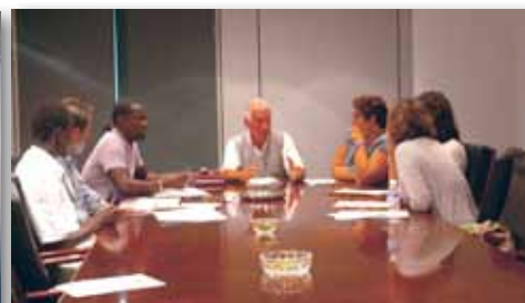
Grup de treball sanitat