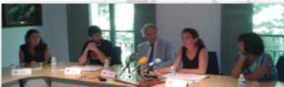
Roda de premsa per denunciar les limitacions d'accés a la sanitat

Equip de Salut Amnistia Internacional Illes Balears illesbalears@es.amnesty.org