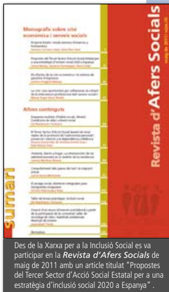
Des de la Xarxa per a la Inclusió Social es va participar en la Revista d'Afers Socials de maig de 2011 amb un article titulat "Propostes del Tercer Sector d'Acció Social Estatal per a una estratègia d'inclusió social 2020 a Espanya".