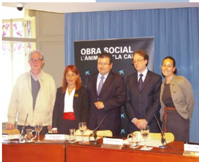
PRESENTACIÓ DE L'ESTUDI "L'IMPACTE DEL PROGRAMA CAIXA-PROINFÀNCIA" de la Fundació "la Caixa", a les Balears, CaixaForum (edifici del Gran Hotel).

- 4 de maig de 2011. Taula rodona "Propostes socials legislatura 2011-2015", a la sala d'actes del Centre de l'Obra Social de "Sa Nostra" del carrer de la Concepció de Palma.