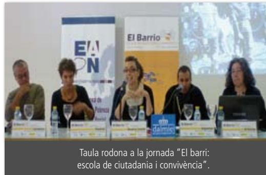
Taula rodona a la jornada "El barri: escola de ciutadania i convivència".