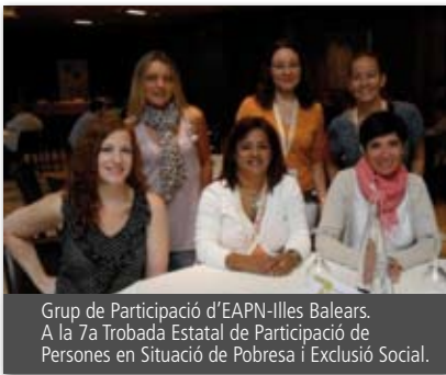
Grup de Participació d'EAPN-Illes Balears. A la 7a Trobada Estatal de Participació de Persones en Situació de Pobresa i Exclusió Social.