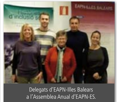
Delegats d'EAPN-Illes Balears a l'Assemblea Anual d'EAPN-ES.