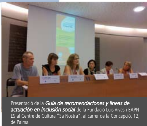
Presentació de la Guía de recomendaciones y líneas de actuación en inclusión social de la Fundació Luis Vives i EAPN-ES al Centre de Cultura "Sa Nostra", al carrer de la Concepció, 12, de Palma

Presentació de la Guía de recomendaciones y líneas de actuación en inclusión social de la Fundació Luis Vives i EAPN-ES al Centre de Cultura "Sa Nostra", al carrer de la Concepció, 12, de Palma.