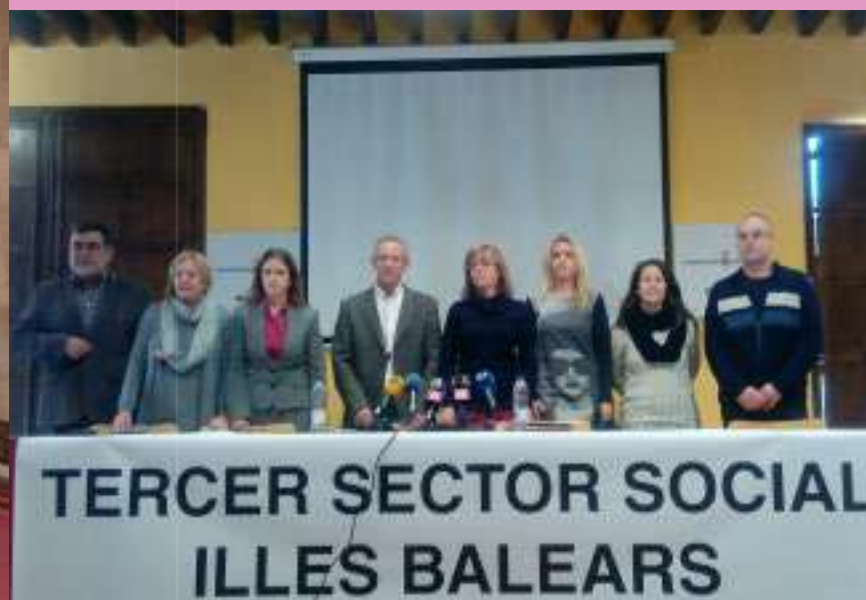
IV10.12.14 Dia Tercer Sector Social