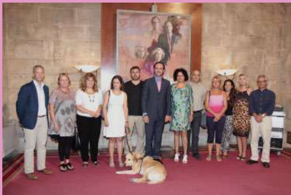
30.07.14 Reunió amb el President del Govern i la Directora del SOIB