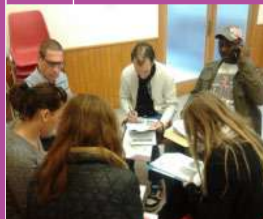
IV Seminari de Participació de Persones en situació d'Exclusió Social , Inca.