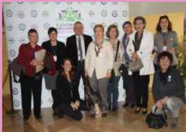
XVII Congrés Estatal del Voluntariat

Per altra banda, els dies 27, 28 i 29 de Novembre des de la Xarxa Balear va participar al XVII Congrés Estatal del Voluntariat.