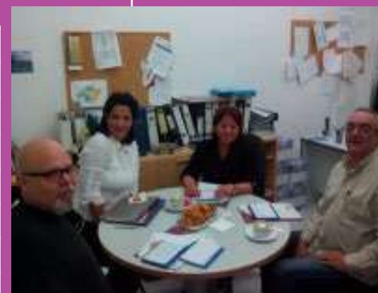
IV Seminari de Participació de Persones en situació d'Exclusió Social, Manacor.