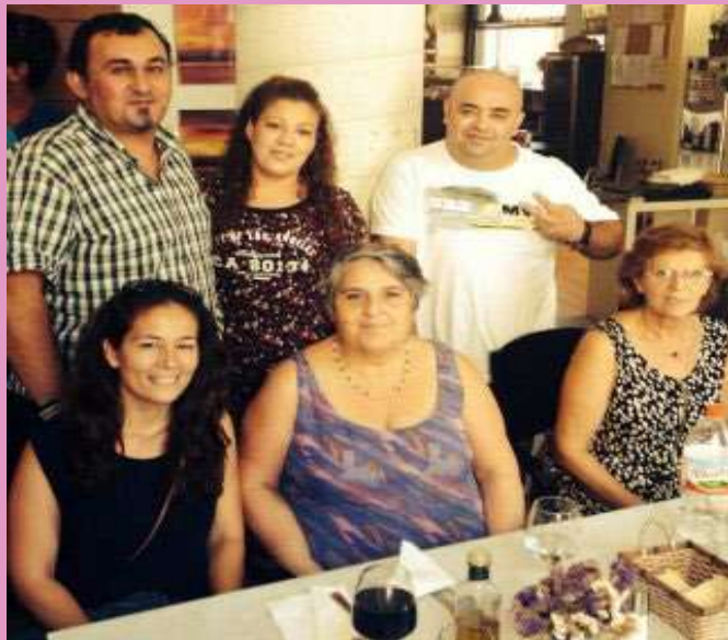
Murcia, IX Seminari de Participació Estatal