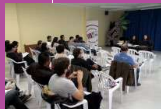
IV Seminari de Participació de Persones en situació d'Exclusió Social, Palma.