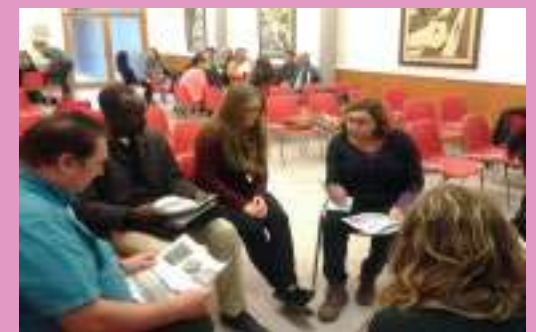
IV Seminari de Participació de Persones en situació d'Exclusió Social Palma, Inca i Manacor.