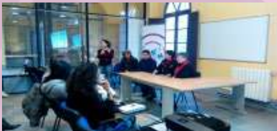
9.12.14 Reunió Informativa PQPI