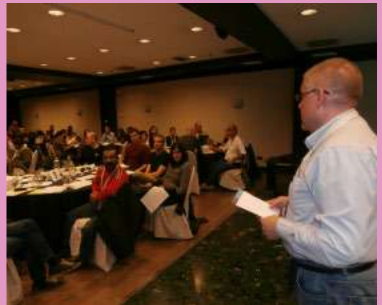
Pamplona, 20 i 21 de Novembre. Assemblea EAPN-ES